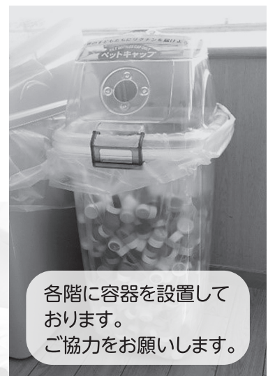
各階に容器を設置しております。 ご協力をお願いします。