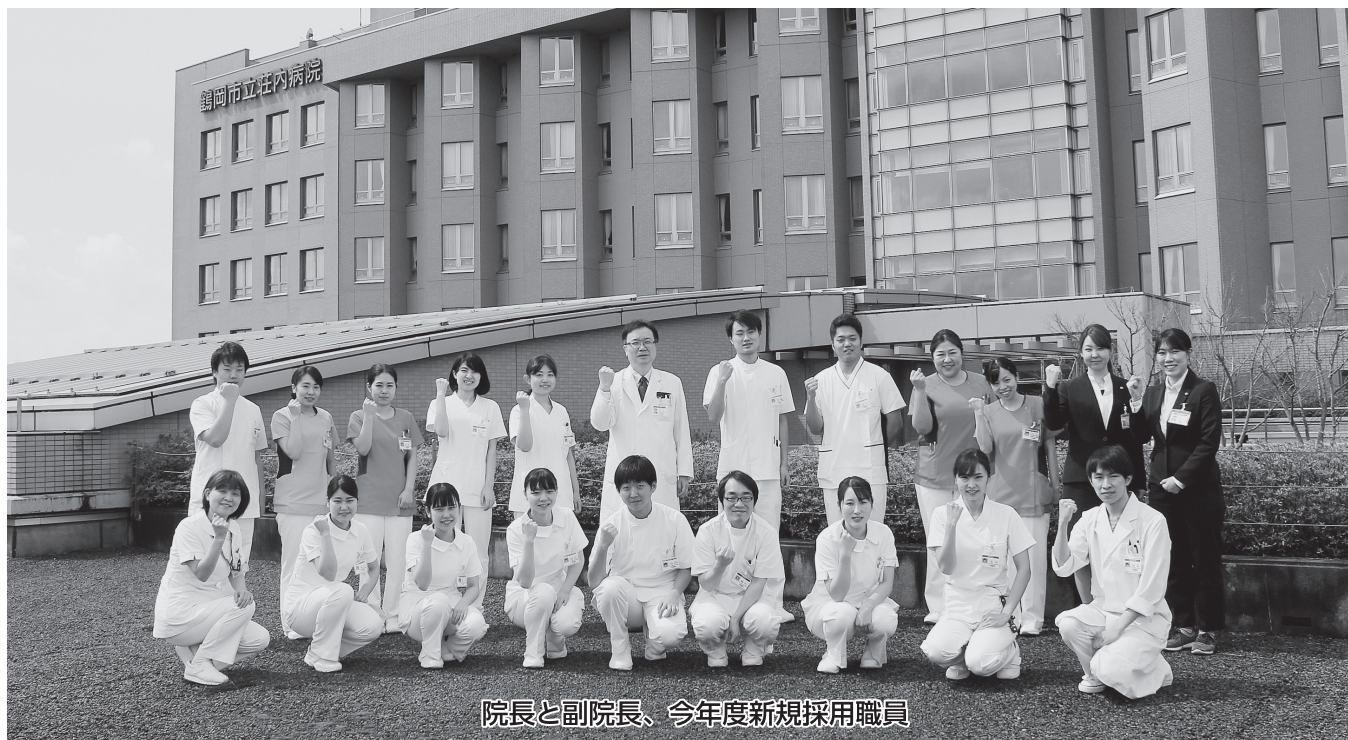
院長と副院長、今年度新規採用職員

特集：看護ケア外来の紹介 ご協力をお願い：安全対策、ペットボトルキャップ回収運動